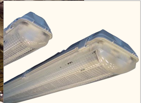
Er zijn verschillende tl-lampen en -armaturen te koop. Op de foto een situatie waarbij enkele tl-buizen zijn vervangen door dubbele.

stallen worden geplaatst. Ze zijn te koop in 100, 150 en 250 watt, maar er worden bijna alleen 250 watt-lampen verkocht om het aantal armaturen te beperken.